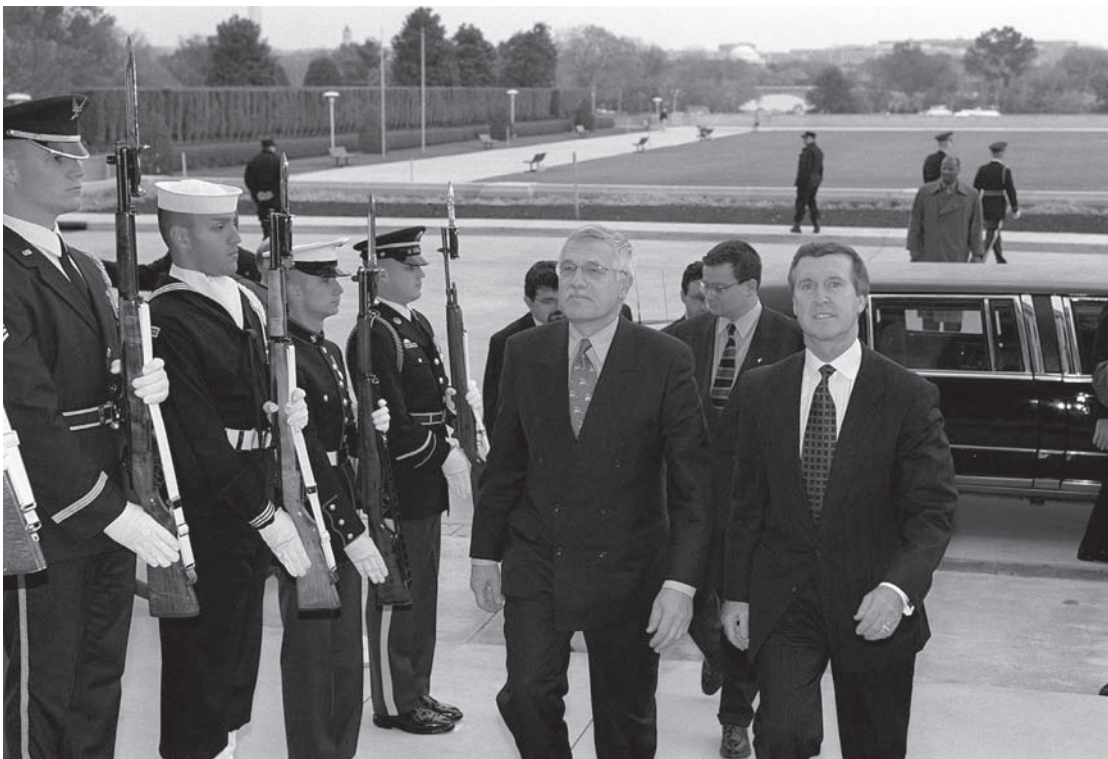
midden Václav Klaus

'inner circles' waarop men zich gedurende deze jaren terug had getrokken. De politieke en economische ontwikkelingen sinds de omwenteling hebben bovendien het onderlinge vertrouwen en respect eerder aangetast dan vergroot. Het is tekenend dat er nog altijd een zeer uitgebreide tweede of informele economie bestaat waarin diensten en goederen worden uitgewisseld op basis van familiale of vriendschappelijke banden. Ook op private ondernemingen kan men immers nauwelijks rekenen. Gebruikmakend van data van de